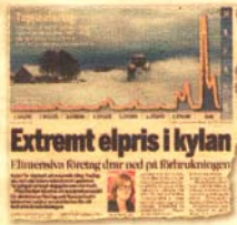
Ur gårdagens Di.