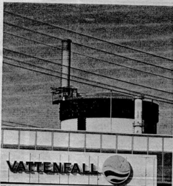
STYR ELPRISET. Vattenfall, Eon och Fortum kontrollerar tillsammans mer än 90 procent av den svenska elproduktionen. En position som lätt kan missbrukas.